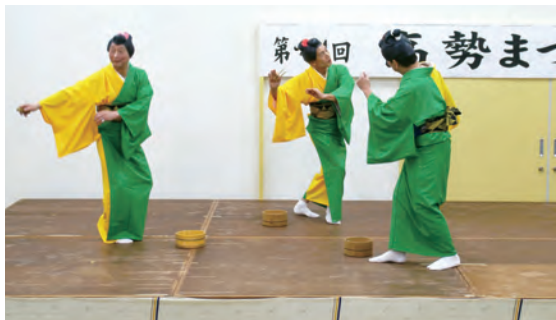
女性に扮して「三朝慕情」