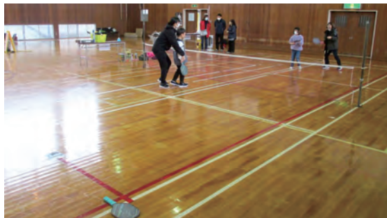
ニュースポーツ、ピックルボールを楽しむ

テニス・バドミントン・卓球が合わさったようなアメリカ発祥のスポーツ「ピックルボール」を体験してみませんか？運動としては緩すぎず激しすぎずちょうど良い強度です。