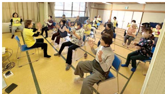
気軽にやってみよう