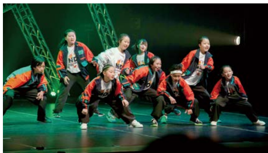
クールなダンスで魅了

日南町総合文化センターでストリートダンスを中心に、小学1年生から高校生まで約40名で毎週活動しています。地方でも本格的なダンスレッスンを。県西部のイベントに出演したり、全国規模のダンスコンテストに出場しています。