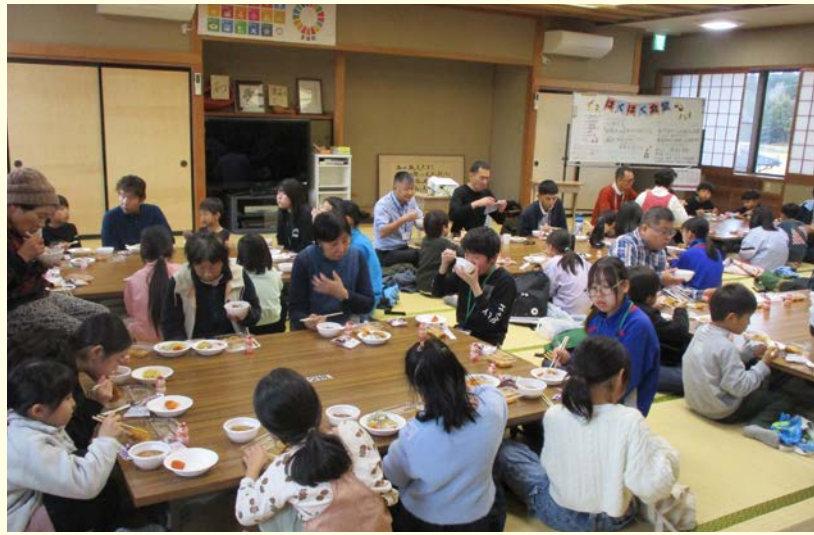
子どもの学習支援なども行う「ほくほく食堂」は4月から誰でも立ち寄れる食堂に食事のみでも参加できる気軽な食堂です

北栄人権文化センターは、隣保館と児童館を併せた施設。祝日と年末年始以外は土日も開館して、差別や偏見、人権侵害の解消など人権を尊重するまちづくりの拠点として活動しています。