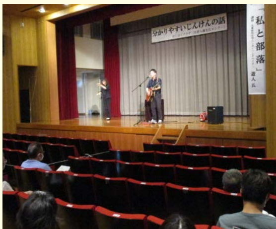
トークと歌で、人権をわかりやすく伝える 世代を超えて心に響く講演会

新しい試みとしてドライアイスを使った「科学実験教室」や「親子ヨガ」を取り入れたところ、子どもだけではなく保護者からも反響がありました。