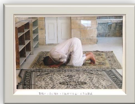
聖地パレスチナで暮らす人々の日常