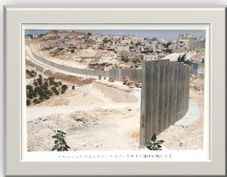
ゴザン地区の西側境界線(右は東側入道住家群)

長い歴史を持ち、三大宗教の聖地パレスチナ。複雑に絡み合う政治状況の下、平和への糸口は未だ見えてきません。日本から遠く離れた国ですが、そこで暮らす人々の日常や現場の様子等に関心を寄せていただけると嬉しいです。