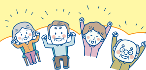
「コグニサイズ」で身体も 脳も健康に!