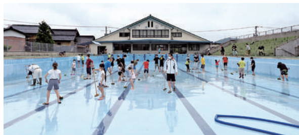
隼プールの「一斉清掃」の様子

隼小学校が閉校になった後も、公民館が中心となり地域の関係団体等とも協働して事業を実施しています。