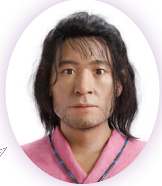
あお や かみ じ ろう 青谷 上寺朗

はじめまして!僕、青谷上寺地遺跡に暮らしていた弥生人です。 去年秋に現代に甦ったんだけど、その時、色んな人に「あの人に似てる!!」って言われて、ちょっと人気者になっちゃた。 全国から公募して、「青谷上寺朗」っていう名前まで付けてもらったんだ。 実は、僕の顔、出土した僕の頭蓋骨をもとにして、「復顔法」という解剖学や人類学の研究成果を使った方法で再現されてるんだ。このフツフツの髪の毛も、歯に残ってたDNA情報をもとに復元したんだ! 僕、最先端の科学で甦えらせてもらったんだね。 現代人さんと全く変わらない、古くフツの顔だと思わない? こんな僕の顔を通して、弥生時代を身近に感じてもらえるとうれいな♪