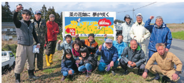
地域づくり講座「Yellow プロジェクト『いろどり高城』」での菜の花畑の看板設置作業の様子

「Yellow プロジェクト『いろどり高城』」では、地域の課題であった耕作放棄地を地域の資源ととらえ、地域で菜の花などを育てる活動を通じて、楽しく交流できる企画や事業に結び付けました。現在は「自然学びの教室」として、地域住民が寄り合い、触れ合える機会や場づくりによる幅広い年齢層に対する取組を継続して行っており、地域の活性化につながっています。