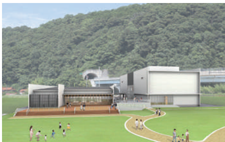
展示ガイダンス施設の完成イメージ