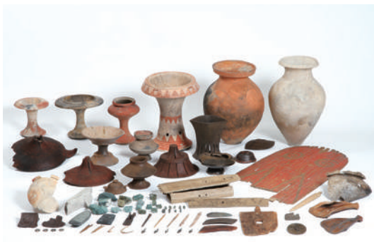
1,353点が国の重要文化財に指定されています