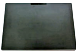
筆者愛用のタブレット端末

マンガを読むことです。特に、「職業モノ」のマンガをよく読んでいます。最近はある特定の職業をテーマにしたマンガも多く、これらを読んでいると行政の仕事しが知らない私にとっては大きな“まなび”になります。