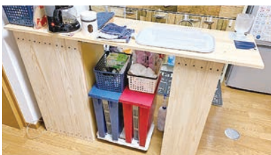
自作のキッチンカウンター

僕は一人暮らしをしています。コロナ禍のためステイホームが続いておりました。そこで、自宅でできることとして、DIYを始めました。家具を直したり、作ったりして、いつも「どうすればいいのかわからないのか、うまくできるのか」熟考しながら楽しんでいます。新しいことを始めるという学びがついてくると思っています。また、これがきっかけで新しいつながりもできました。