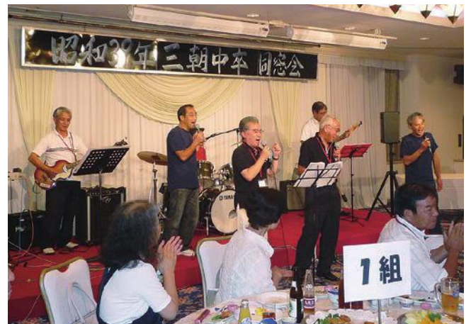
三朝町立三朝中学校（昭和39年卒）同窓会で演奏

結成から12年が経過し、メンバーの平均年齢も上がりました。あと何年活動できるかわかりませんが、元気で楽しく活動を続けていきたいという想いでいっぱいです。「とんがり倶楽部バンド」の活動をとおして、地域の人に元気を届け、にぎわいのある三朝町になるよう尽力したいと思います。