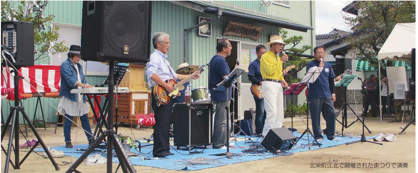
北栄町江北で開催されたまつりで演奏