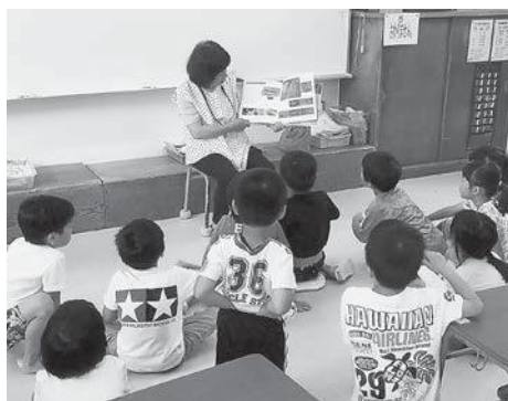
真剣に聴き入る子どもたち

平成 26 年には、子どもの読書活動優秀実践団体文部科学大臣表彰を受賞。とても光栄に感じるとともに、「しゃぼん玉」の地域における子どもたちへの役割は大きいと考えています。会員一同ますます精進し、これからも本を読むことの楽しさを子どもたちに伝えていきたいです。