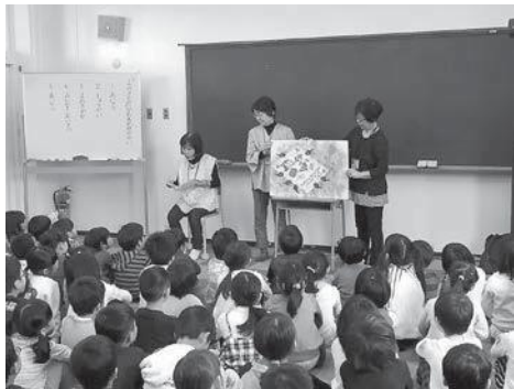
倉吉市立社小学校での読み聞かせ