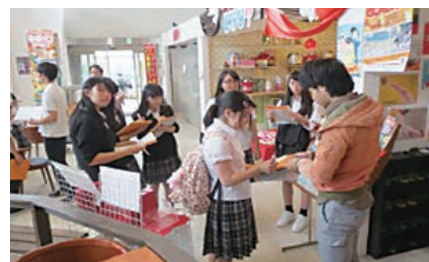
地域の課題や魅力を探るフィールドワーク

教科で学んだことや部活動を通して、地域のニーズに対応した様々な地域貢献を行っています。総合的な学習の時間で、1年次にはキャリアデザインについて学び、2年次には仮想思考などの問題解決学習スキルの習得を行い、3年次には「米×米プロジェクト」として「米子市中心市街地活性化事業計画」の策定案を発表しています。フィールドワークやワークショップなどを通して、「経済産業省地域経済分析システム（RESAS：リーサス）」を活用した地域事例研究に取り組んでいます。