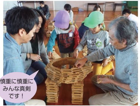
慎重に慎重にみんな真剣です！

最初に、親子で一緒に協力して街並みを作りました。キリンやかまくらも作り、完成したキリンにまたがったり、かまくらに入ったりして楽しみました。参加者みんなで協力してナイアガラの滝も完成。最後に、カウントダウンでドミノのように崩すと、子どもたちの「ワー！」という歓声が会場いっぱいにあふれました。会場に集まったみんなが楽しみ、カブラを通して親子のふれあいが深まりました。