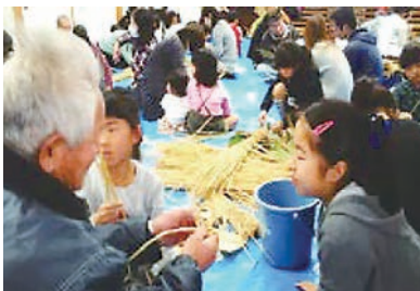
地域の方の指導による「しめ飾り」

また、創立30周年の節目に、「同時におむすびを握る世界最多人数」に挑戦し、ギネスの世界記録を達成しました。