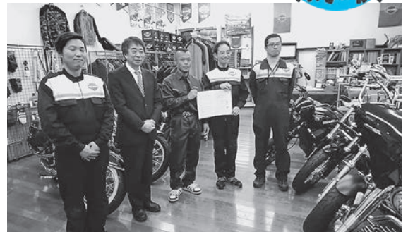
二輪車のオイル交換1回につき100円が復興ボランティア活動に！ 企業名：㈱ライダーズスポット ムラタ