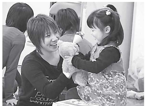
10代の保育ボランティア活動

ニーズや困りごとに対して、身近なところで「やりたいこと」「できること」がつながれば、ボランティアに参加する時間がとれないと言われる若い世代であっても、自分を活かせる機会は広がるのではないのでしょうか。