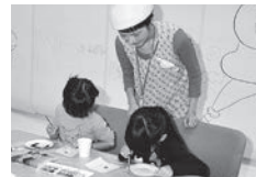
Clara (クララ) のワークショップ 「らくがき段ボール」 1月13日(土)・14日(日) 10:00～16:00