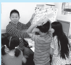
アーチストリンク作品展