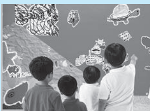
シャッフルぬりえ