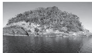
中海に浮かぶ無人島「萱島」。戦前に料亭「たつみ」が存在した。

見える人と見えない人が一緒に楽しむ鑑賞ワークショップ 3月10日(土) 14:30～16:00