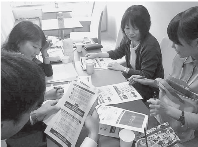
月数回程度行われるプロボノのミーティング風景

(公財) とっとり県民活動活性化センター (以下「センター」) では、ボランティア活動支援の一つの試みとして、平成 26 年から「とっとりプロボノプロジェクト」を立ち上げています。プロボノとは、“公共善のために”を意味するラテン語「Pro Bono Publico」を語源とする言葉で、社会・公共のために職業上のスキルや専門的知識を活かしたボランティア活動です。ボランティア参加が比較的少ないと言われる 20～40 代をターゲットに個人の立場で登録いただき、①4～6名のチームを組んで ②週5時間程度、6ヶ月の期間限定で ③ミーティングは月1回程度、メールを中心に ④成果を出すことにこだわって、NPOなどの組織支援に入っただけでなく、地域課題の解決に挑んでいる人々との「出会い」、自らのスキルを試し、成果につながる「達成感・自己効力感」、職場の枠を超えた新たな「つながり」など、無償だからこそ「お金に代えられない報酬」が得られることが大きな魅力です。