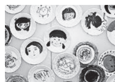
Clara (クララ) のワークショップ 「ニコニコ顔を描いてみよう！」 1月28日(日) 10:00～16:00