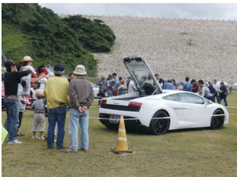
音楽祭には、スーパーカーもやってきて、にぎやかです！