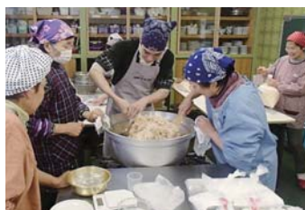
郷土料理を学ぶ料理講習会