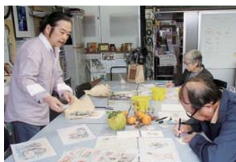
廃校を利用したアトリエ小学校