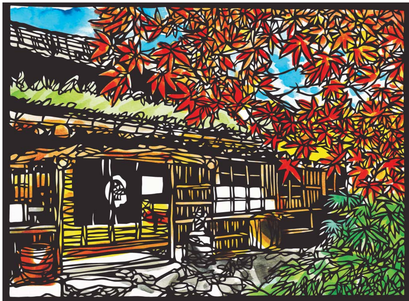
『切り絵シリーズ』三滝溪谷の紅葉（智頭町）