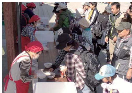
おもてなし隊によるおもてなし

以前、この地区にあった成器小学校は、平成 14 年 3 月に閉校。廃校となった校舎を活用し、地区出身の画家が開設した「アトリエ小学校」で絵画講習会や展示会などを行い、学びの場と地域のにぎわい創出の拠点として活用しています。