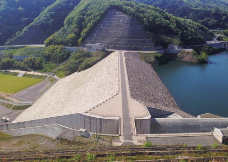
※殿ダム 高さ約 75 m、長さ約 294 m、総貯水容量 1,240 万㎡。自然にある土や岩石を積み上げて作った多目的ダムです。

そのような中、平成元年、当時の国府町立成器小学校（以下「成器小学校」）校長の発案で、「いきいき成器」というキャッチフレーズが誕生。いきいきと生きる力を養い、課題解決に向けて住民が一丸となって活動を展開していこうという「成器の精神」が確立しました。地区内には「あたたかい、あいさつがこだまするいきいき成器の里」という看板が掲げられ、現在もその精神が息づいています。