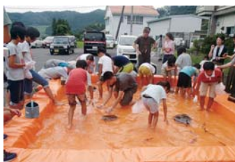
「わくわく探検 公民館に泊まろう！」の 1 コマ