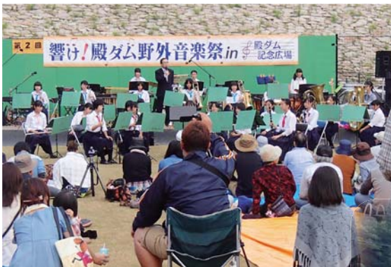
響け！殿ダム 野外音楽祭

公民館と成器の会、住民が強固なスクラムを組んで行う様々な取組は、確実に定着しつつあります。「いきいき成器」の精神は、地区内外に広がっています。