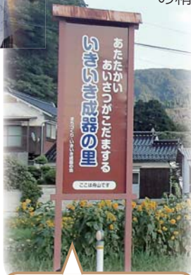
地区内に設置された「いきいき成器の里」の看板と、住民により「成器のお花畑」と命名された花壇。毎年、有志により季節の花が植えられています。