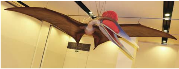
“史上最大のつばさ” ケツァルコアトルス生体復元模型 (北九州市立自然史・歴史博物館蔵)

地球の歴史上で空を飛ぶ能力を手に入れたのは、昆虫、翼竜、鳥、コウモリの4グループだけです。