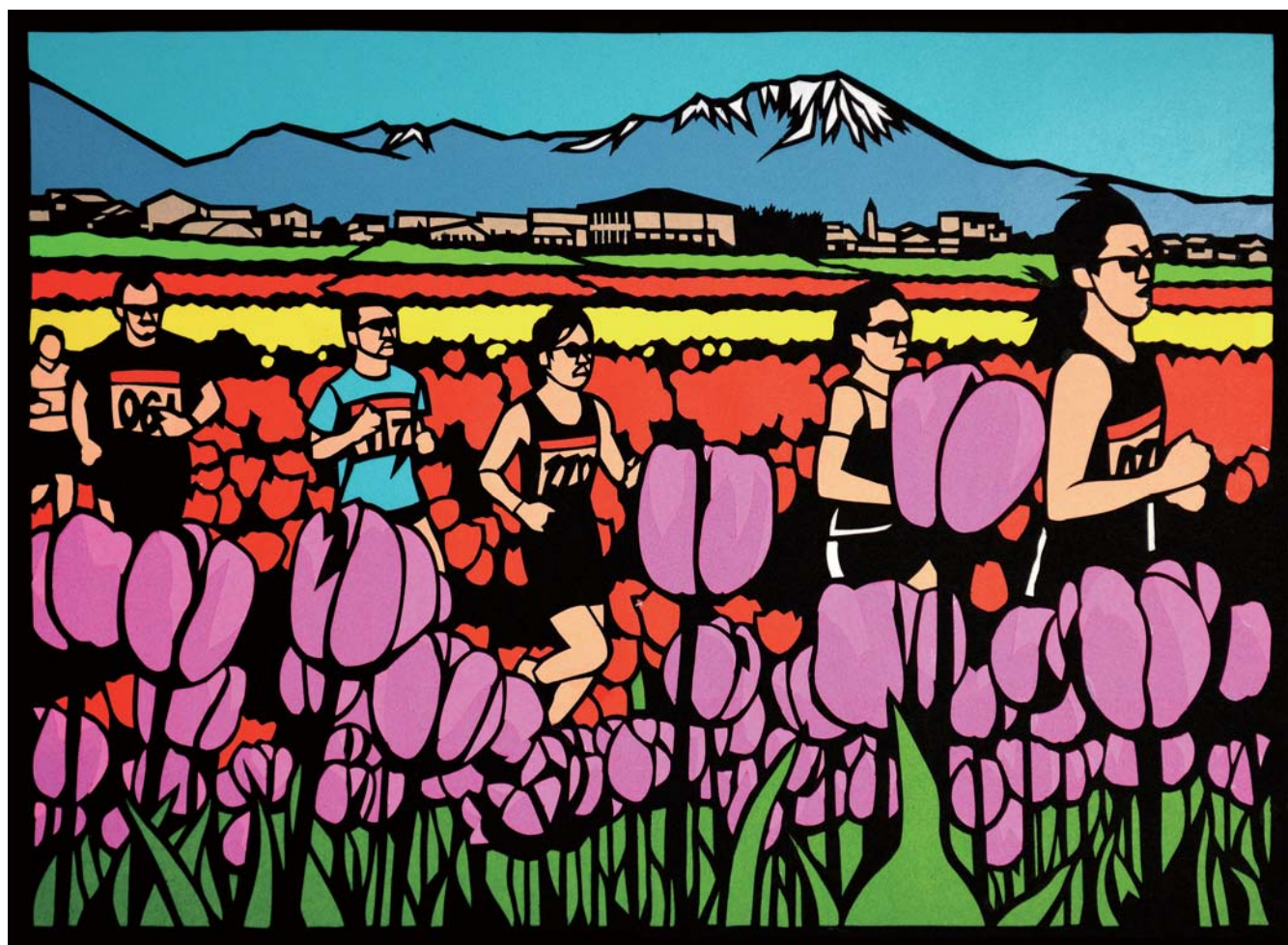
『切り絵シリーズ』日吉津村チューリップマラソン (日吉津村)

咲き誇る色とりどりのチューリップを眺めながら走る日吉津村チューリップマラソンは、すっかり春の風物詩として定着したようです。