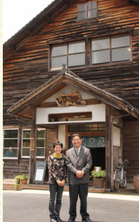
●いんしゅう鹿野まちづくり合宿の会場となっているカフェ・ギャラリー「しかの心」

今、熱い思いを持って活動されている組織も、続けていくうちにどうしても疲弊していきます。公民館は、組織が行き詰まったときにどう応援していただけるか。その支援システムを作っていくことがこれからの課題です。うれしいことに、鹿野の子どもたちの意識調査で90%以上が「まちが好きだ」という結果が出て、学年が上がるほどパーセンテージが高いんです。まちづくりは人づくり。いろいろな人、特に若い人達にも関わってもらいながら、後継者を育成していくことに力を入れていきたいと思っています。