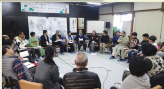
●車座になって鹿野の将来について語り合う「車座トーク」