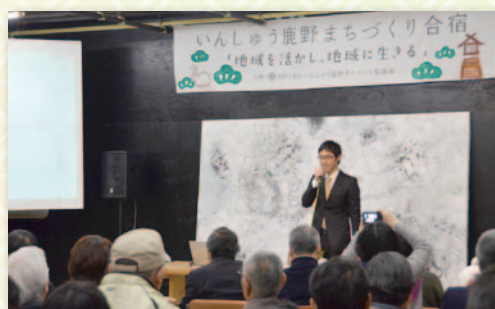
●まちづくり合宿のようす

また、いんしゅう鹿野まちづくり協議会と共催で実施する「まちづくり合宿」は、全国から元気の良い先進地区の面々を招いて、地域の取り組みを学ぶ場所として開催しています。私たちにとっては次に向けての活力になっているし、来られた方にとっても情報交換の場になっているようですね。講師で来られた方も少ない謝礼で喜んでいただけるのがありがたい。お互いに刺激を受け合う貴重な機会です。その中で行う「車座トーク」は、参加者全員が輪になって座談会をすることで、みんなの顔も見えし隣の人とも気楽に話せる。雰囲気がとてもいいですね。「おふくろの味フェスタ」は、その時のアイデアで生まれたものです。