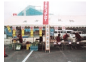
米子義方公民館へ出店

この交流により、日光地区の魅力を知ってもらい、少子高齢化の危機を脱却するための知恵を捻出できるきっかけになれば良いと考えています。