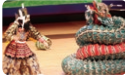
日南神楽 神社社(日南町)