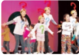
ミュージカル劇団Joy(米子市)

地元鳥取県の将来を担う子どもたちを育成するための教育活動や、地域の伝統文化を振興・継承する活動などを行う鳥取県内の団体に助成しています。