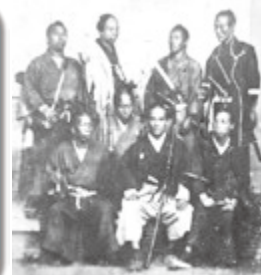
鳥取藩二十二士とその同志たち(個人蔵)