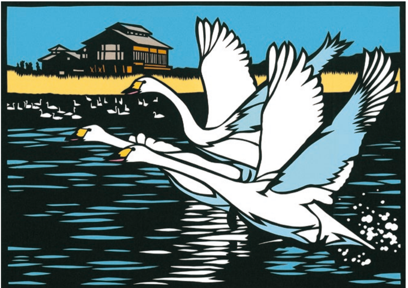
『切り絵シリーズ』 米子水鳥公園のコハクチョウ(米子市)

もう少しすると、冬の使者コハクチョウの飛来。年々、地球環境が変わって行くなか、今年もちゃんと来てくれるのか少し心配です。