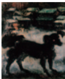
須田国太郎《犬》1950年 東京国立近代美術館蔵