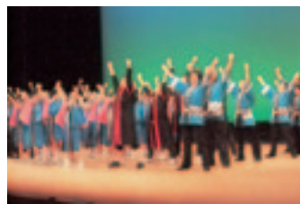
【復活した明倫音頭の披露】

小学生からお年寄りまで色々な世代が関わったことで、それぞれの役割や活躍の場ができ、役立ち感や達成感を感じることで、地域に活力が生まれています。