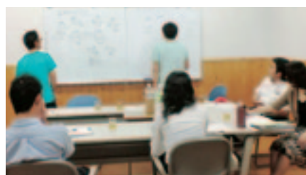
活動家養成セミナー

青年が生活していく上での、悩みや問題点、1年間の青年団活動をレポートに書くことで、自分自身を振り返り来年度へつなげるための研修会です。