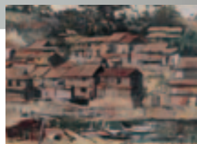
須田国太郎《漁村田後》 1936年 鳥取県立博物館蔵