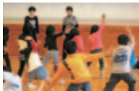
【高校生による振り付け】

地区の小学校で踊り継がれていた「明倫音頭」「新明倫音頭」は20年以上踊られていませんでしたが、小学校100周年の準備の際に、古い1枚の譜面が見つかり、この譜面をもとに、子どもから高齢者までの異世代、学校、家庭、地域が一体となって「明倫音頭」の復活に取り組みられました。音源の再生を地区のお父さんバンド、演奏を小中学生バンド、よさこいパージョンの振り付け