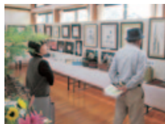
【住民手作りの作品展を楽しむ】

棚田の散策や山菜料理づくり、住民の作品展などを行っておられ、参加者からは、「豊かな自然の中で地域の魅力を再発見できる」と好評を博しています。そのほか、『高山』登山道の整備、「西郷を語る会」などを通して、協力してよりよい地域をつくらうとする意欲と気運が高まりつつあり、地域づくりに向けた新たな事業が実行に移されるようになりました。