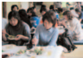
【山菜料理のバイキングは大好評】

西郷地区は、湯谷温泉や三滝溪等の自然及び歴史文化遺産に恵まれ、三つの窯元や俳人田中寒楼の生誕地として知られる農山村地域で、住民アンケートを行って、「いなば西郷むらづくり計画」を策定し、住民主体による地域課題の解決に取り組んでおられます。「西郷まるごと博物館ぎゃらりーあっちこっち」では、約80人のスタッフが協力して、地域の特色を活かした