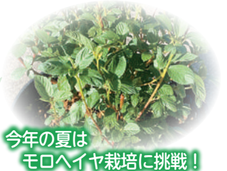
今年の夏はモロヘイヤ栽培に挑戦！

庭で野菜やハーブなどを育てています。それぞれの作物にあった育て方や、収穫量を増やすコツなど、気になったタイミングで調べては、すぐに実践！新たな学びの連続です。