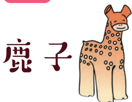
北栄町文化財キャラクター

昨年8月に北栄町文化財キャラクター しかこ 「鹿子」が誕生しました！北栄町 はした 土下で出土した、小鹿の埴輪をモチーフにしています。北栄町公式 Facebook や広報誌で北栄町の文化財情報をお届けしています。ぜひご覧ください。