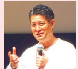
講師は studio-L 代表 関西学院大学 教授 山崎 亮さん

山崎亮さん (株式会社 studio-L 代表) に「一歩、まちへ! 一歩、前へ!」と題してご講演いただきました。「人口が減っても、哲学を持つ大人や高校生が増えるなら未来は明るい。そんな地域こそ豊かな地域」「図書館は、お金を使わず世界を楽しく見ることができる場所」と話されました。