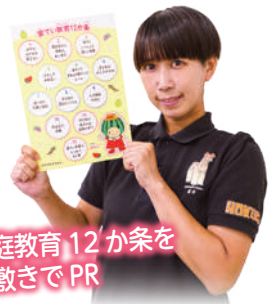
家庭教育12か条を下敷きでPR

主に社会教育や家庭教育、青少年育成に関する業務を担当しています。これらの業務には地域の方の協力が不可欠です。協力して下さる方とのつながりを大切にすることを心掛けて、日々の業務に取り組んでいます。その他、社会体育や文化・文化財など、チームで連携し、様々な業務に関わっています。