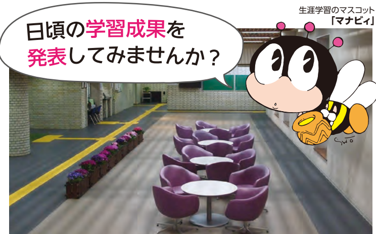
1階ロビー (展示コーナーは奥側のスペース)