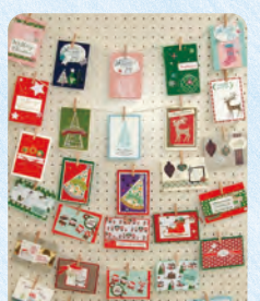
ペーパーデコレーション