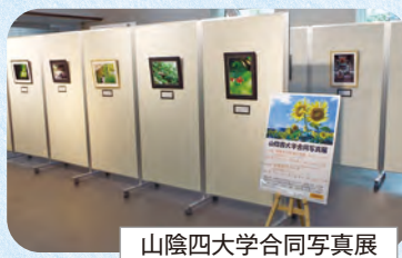
山陰四大学合同写真展