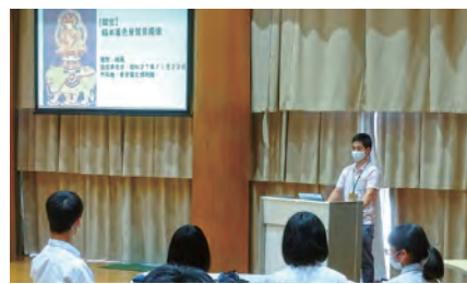
智頭中学校3年生の発表（町内文化財保存事業）

令和3年度の智頭中学校3年生の修学旅行は、コロナの影響で鳥取・島根両県を巡りました。松江城や石見銀山を訪れたことで地元智頭町の文化財を考えるきっかけになり、中学校、教育委員会、図書館が協力して、生徒が町内文化財を撮影してデジタルデータに残す事業に繋がりました。コロナ禍で大変なことが多いですが、新たな事業の創出や既存の事業を見直すきっかけにもなりました。