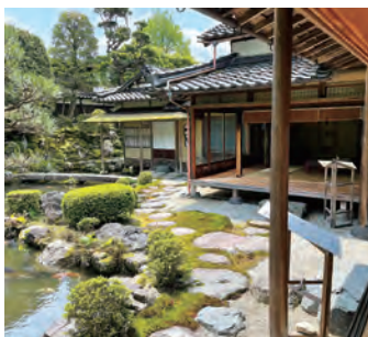
庭園もすばらしい「石谷家住宅」