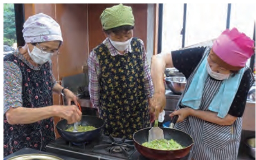
さば缶の 大根サラダ