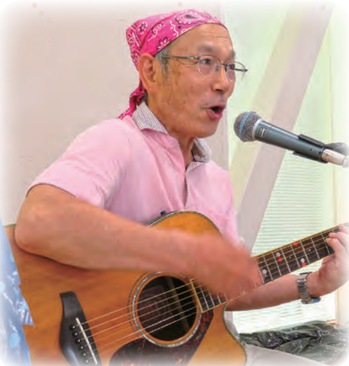
手拍子できる歌、青春の歌シリーズ、鳥取にまつわる歌

マイク、アンプ、机、椅子などは用意します。発表を希望される場合は、ご相談ください！ ※発表される団体などが決定次第、ホームページ・新聞などでお知らせします。