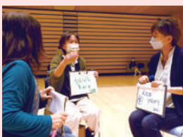
感想交流のようす