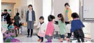
ミニコンサートの様子