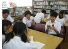
朝読書を図書館で ～Talk About a Book～

特に、東郷中学生が選んだ「たくましく生き抜く人」50選の本を展示するなど、生徒自らが本を通して「人」に出会う取組を行いました。また、図書委員会が選んだ記事について全校生徒が意見や感想文を書く活動「中学生だから！新聞を読んで考えよう」を進めるなど、生徒自らが読書活動の推進に関わっています。また、絵画集や理科の鉱物などを展示したり、町立図書館と連携して授業で使用する専門書等を準備したり、授業後にコーナーを設置して関連図書の読書を促すなど、常に図書館の存在感が感じられる取組を進めています。