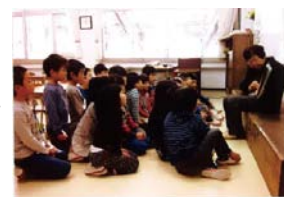
社小学校での読み聞かせ

特別支援学級を含めた小学校、保育園、児童センター、高齢者福祉施設などの施設、地元でのおはなし会の開催などにより、子どもたちや保護者の皆さんに、本やおはなしの楽しさ、素晴らしさを伝えていきます。また、そうした楽しさ、素晴らしさを伝えていくためにも、定例会や様々な研修への参加により、メンバーのスキルアップも継続的に取り組んでいます。