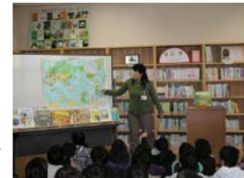
司書教諭による学習（四年生 国語）

司書教諭を中心に、図書館担当教員、学校司書が協力し、「読んでほしい本40冊」「読書ラリー」「先生のおすすめの本」などの推薦リストを子どもたちに提供し、子どもと本との出会いの場を創っており、これにより、貸出冊数の増加（一人平均80冊以上）だけでなく、児童が選ぶ本の質の向上も見られるようになりました。