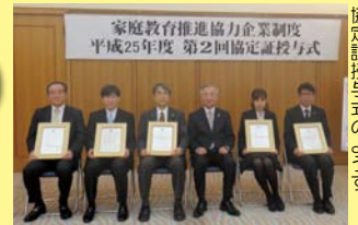
協定証授与式のようす