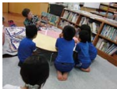
おはなし会の様子

『「図書館が好き」から始まる、広がる』を目指し、イベント「来たろう！鬼太郎としゃかん」や「おはなし会」等を開催して、子どもにとって居心地がよい図書館づくりを進めているほか、図書館だよりや校内掲示板を活用して児童生徒、教職員への情報発信にも積極的に取り組み、学習における図書資料の活用も増えています。