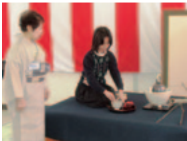
お茶のお点前披露

日頃の練習の成果を披露する「お茶席」をはじめ、体験コーナー、遊びのひろば、リユースバザー、ロビー展示など盛りだくさんの内容で一日中盛り上がりました。体験コーナーには、プラ板、マイ鉛筆、写真立て、しおり作りのブースがあり、ママさんボランティア