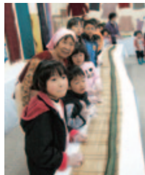
巻き寿司巻けたよ

に教わりながら思い思いの作品をつくりました。遊びのひろばでは、ジャンボパズルやアナログゲームなどで賑わいました。子ども用品のリユースバザーにもたくさんの品物が集まり、品定めをするお母さんたちで大賑わいでした。売上金は全額東日本大震災の義援金とさせていただきます。