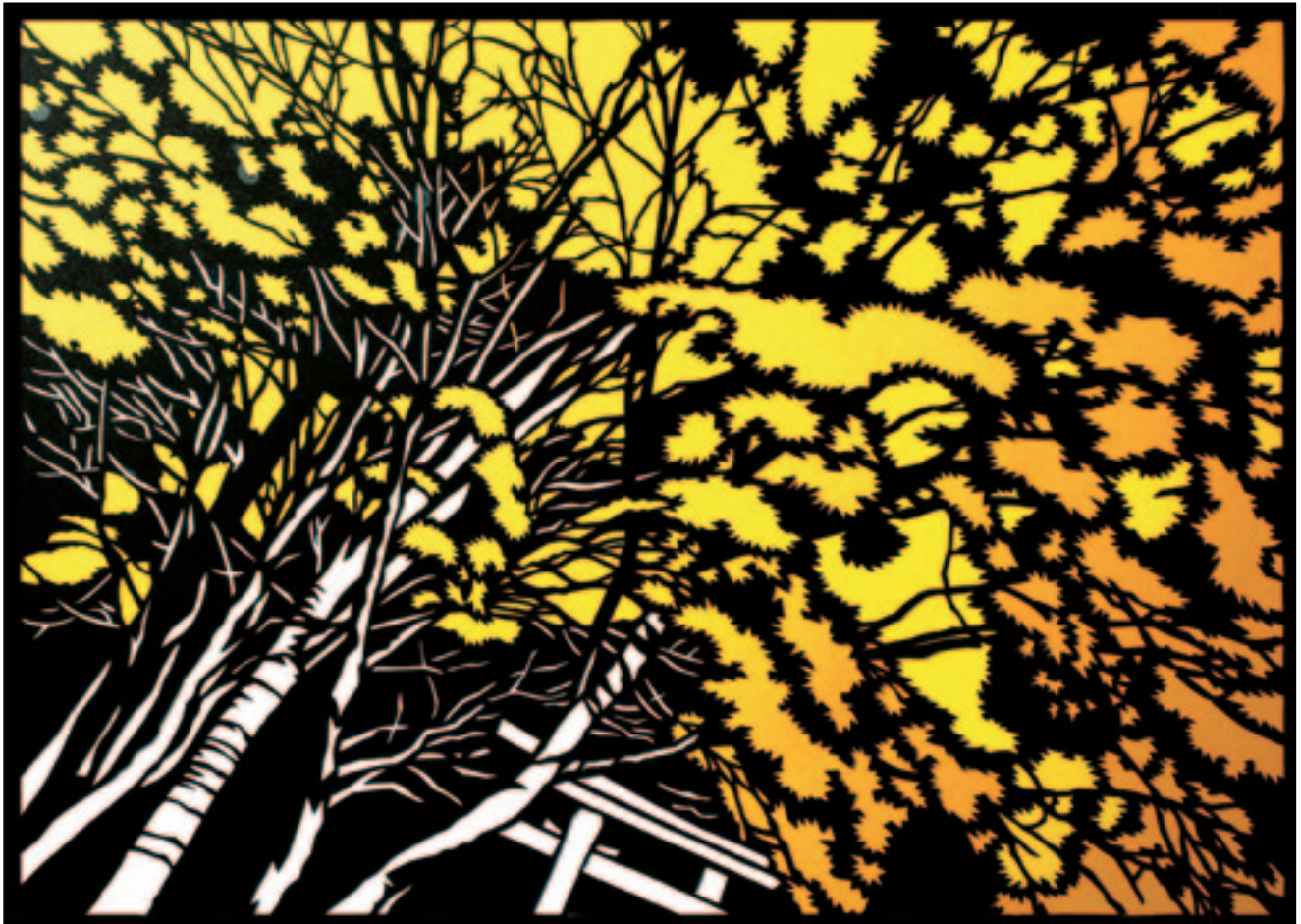
『切り絵シリーズ』 紅葉の智頭・板井原(智頭町)

真っ赤な紅葉もさることながら、黄色のグラデーションにも圧倒されます。酷暑の夏がウソのような里山のすがすがしい空気です。