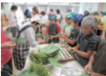
ささまき体験(地域の楽校づくりの会)

当公民館は立地的に大変恵まれた環境で、隣接して保育園・小学校があり、校区民運動会はもちろん、年間を通じ様々な場面で連携して活動しています。平成12年には小学校の改築をきっかけに、PTA役員・OB、教職員などが中心となって『地域(みんな)の楽校づくりの会』を発足し、今年で12年目を迎えます。ここでは地域の高齢者の方にご協力をいただきながら、公民館も共催して、笹まき作り、川遊び、料理教室、もちつき等の体験を行い、