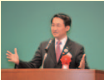
平井知事による開会式のあいさつ

テーマは「学びを広げる ひとをはぐくむ学校図書館」。全79の分科会は講義、実践発表、図書を使う学習のワークショップ、図書館視察など多彩で、体験的な学び・活発な意見交換を通して交流の輪が