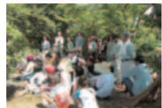
清掃ボランティア

機会を持ち、若い親同士の交流の場となったり、公民館側も他の事業へ声を掛けやすい関係づくりができています。放課後児童クラブの指導員の方とも連携し、夏休みに公民館で工作教室を行うなど、地域の方の集いの場として『身近な公民館』となるよう心掛けています。