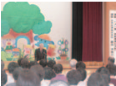
偉人講演会「澤 春蔵～一人一業、自動車業は天職～」

その取組として、ふるさとの偉人を地域に紹介していこうと、日本交通株式会社の創業者、澤 春蔵氏をはじめとする5名の「偉人講演会」を開催し、