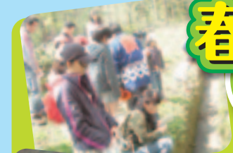
自然とのふれあいプログラム

期 日 平成24年4月30日(月) 対 象 県民一般どなたでも 参加費 無料(おやつづくりは材料費が必要)