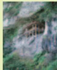
三徳山三佛寺・投入堂

三徳山観光ガイド【有料】 連絡先：三朝温泉観光協会 TEL 0858-43-0431