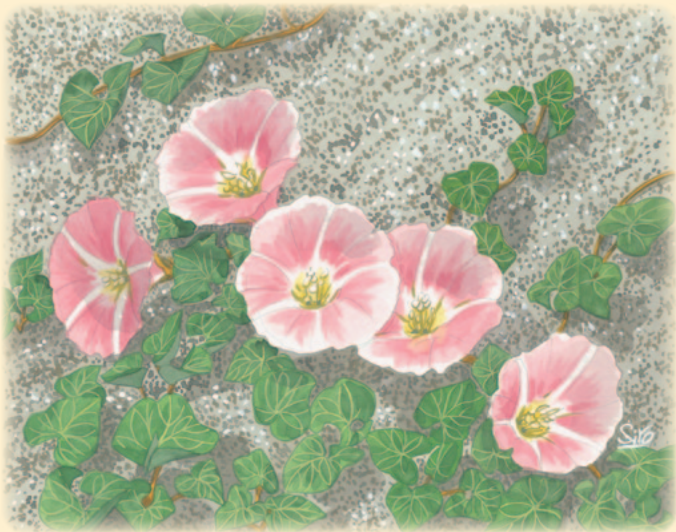
『地域の花』北栄町 ハマヒルガオ 画：紙原 四郎 氏