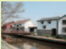
米子加茂川沿い土蔵群

「米子下町観光ガイド」【無料】 連絡先：米子市観光案内所 TEL 0859-22-6317