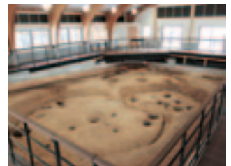
発掘調査された竪穴住居跡を露出展示