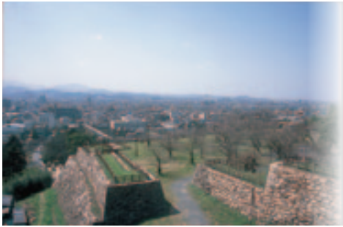
鳥取城跡・二ノ丸跡

江戸時代に因幡・伯耆二国を支配した鳥取池田家は、全国でも12番目に大きな大名でした。羽柴秀吉の「兵糧攻め」でも名高い山頂の城跡、その麓に重畳と築かれた鳥取藩時代の石垣、明治の近代化を象徴する白亜の洋館・仁風閣、11代の殿様が眠る鳥取藩主池田家墓所など、鳥取藩32万石の威容と伝統を伝える文化遺産が数多く伝わっています。