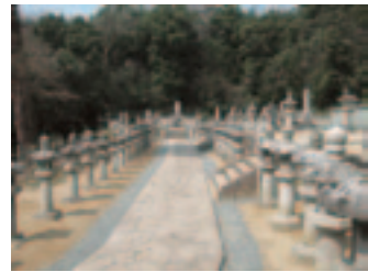
鳥取藩主池田家墓所