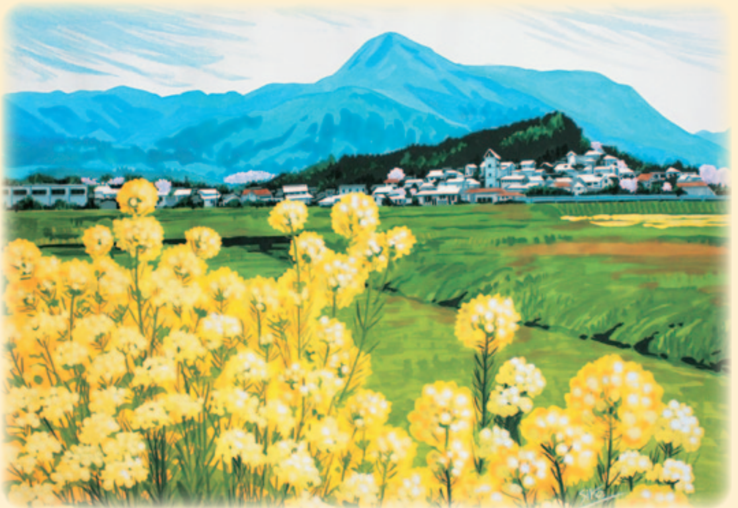
春の鷲峰山（鹿野町） 画：紙原 四郎 氏