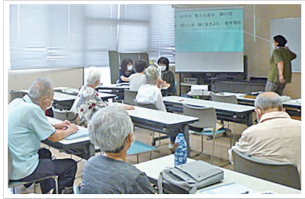
例会等でも要約筆記による情報保障をしています。 日時：毎月第4日曜日 10：00～12：00 場所：さわやか会館又はさざんか会館

<設立年> 平成6年 <会 員> 20名 ○団体への加入方法 代表者または事務局に申し込みをお願いします。 ○入会金：なし 年会費：1,500円