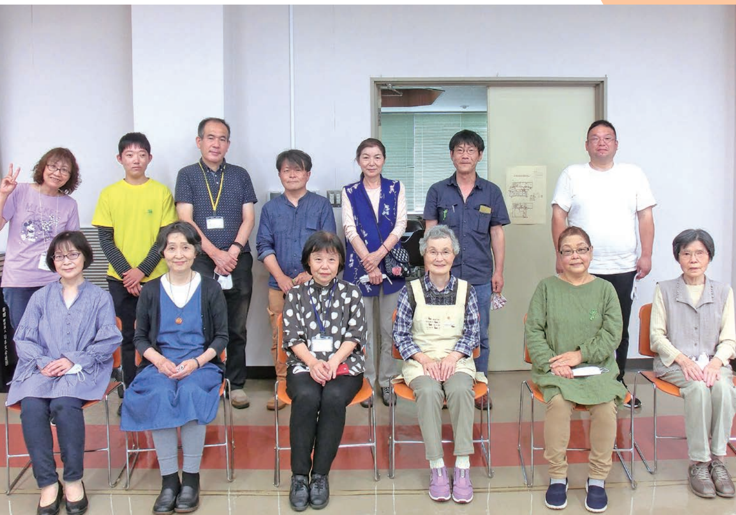
活動日には各地から「ひのぼらねっと」のメンバーが集まります

生涯学習とっとり vol. 196 2021.9 学びから行動へ、行動から学びへの循環