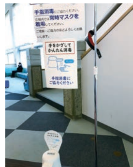
コロナ対策万全で開催しました。