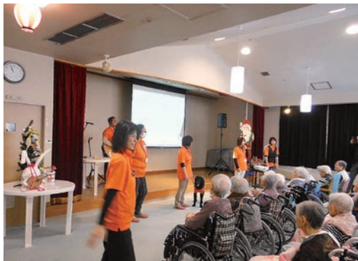
皆様に喜んでいただける、なくてはならない団体を目指しています。