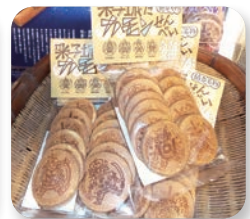
「米子城にカモン せんべい」

米子城ゆかりの武将を図案化した「御将印」は全国的にも珍しい取組。文字はガイドが書いたもの。