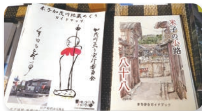
町家や小路を紹介する冊子