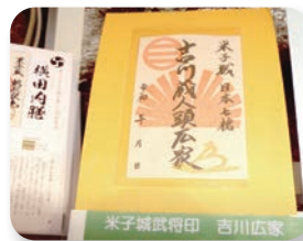
吉川広家の「御将印」

米子城ゆかりの武将を図案化した「御将印」は全国的にも珍しい取組。文字はガイドが書いたもの。