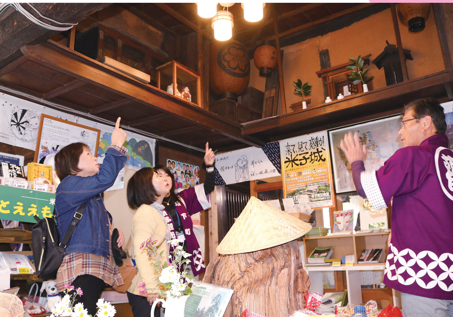
ガイドが米子の町屋に特徴的な吹き抜けの天井を説明中

生涯学習とっとり vol. 193 2021.3 学びから行動へ、行動から学びへの循環