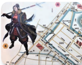
「米子城古今絵図 クリアファイル」

米子城跡や城下町米子をモチーフにしたお土産はめずらしい！と評判です。この他にも、たくさんのオリジナル商品が手に入ります♪