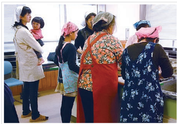
栄養士の先生をお迎えして楽しく料理教室。小学生も参加しました。

30代～ 80代の 18名。主婦や会社員、食育指導員、食育推進員や管理栄養士などの資格をもつ会員まで、幅広いメンバーで活動しています。