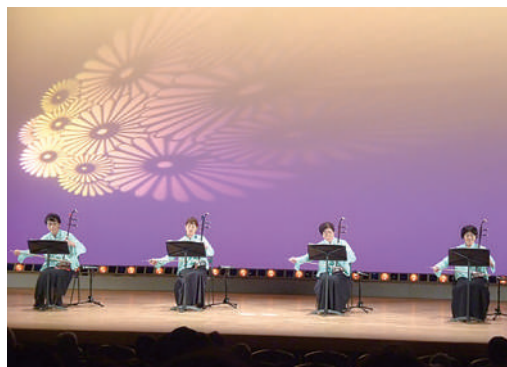
昨年のゆりはま文化芸能祭(芸能大会)に出演した時の様子