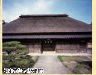
河本家住宅(琴浦町)