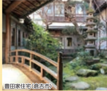
豊田家住宅(倉吉市)